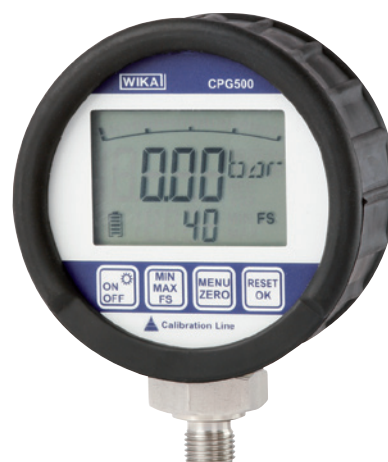
Преобразователь давления CPG500

Высокая скорость измерений 100 измерений в секунду позволяет определять быстрые перепады давления, а также пики и падения. Дисплей имеет функцию гистограммы, указания предельного измеренного давления, функцию обновляемых значений MIN/MAX, что делает эффективным анализ измеряемого значения.